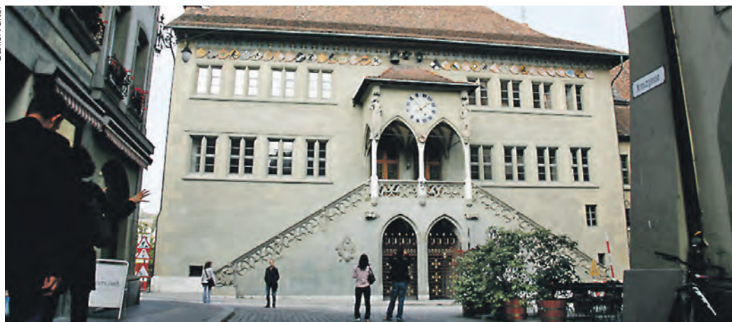
Die Idylle rund um das Berner Rathaus trägt – es weht ein eiskalter Sparwind durchs Kantonsparlament