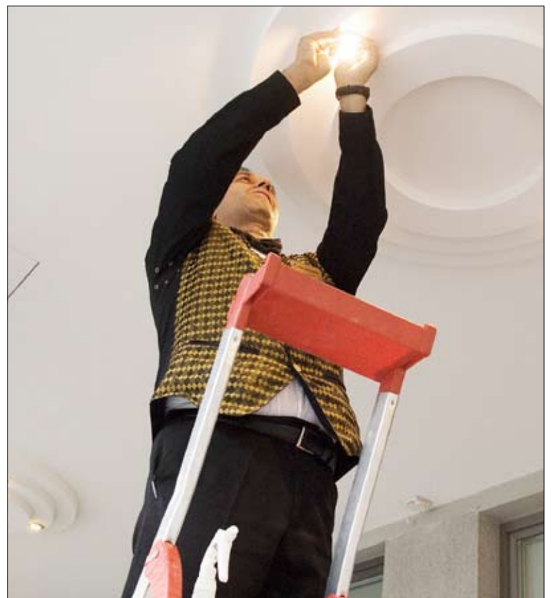
Die Lichter gehen in einer 2000-Watt-Gesellschaft nicht aus.

2. Energieeffizienz – nicht verbrauchte Energie ist die billigste und sauberste Energie: Energie ist ein kostbares Gut, sei es, weil Öl-, Gas- und Kohlereserven endlich sind, die Atomenergienutzung radioaktive Abfälle