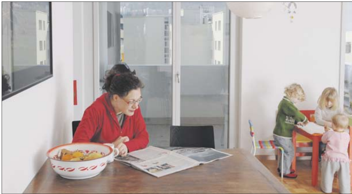
Mit dem Minergie-Standard – wie in dieser sanierten Wohnung – lebt es sich genauso komfortabel.